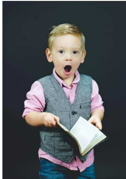
”I Sang og Glæde Er Gud til Stede, Thi Gud er Sangenes Kildespring!”